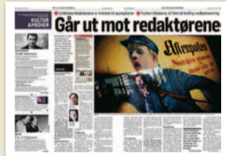
Klassekampen 28. juni

■ Et av de foreslåtte tiltakene er mer utveksling av anmelderstoff.