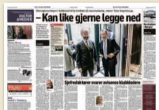
Klassekampen 29. juni