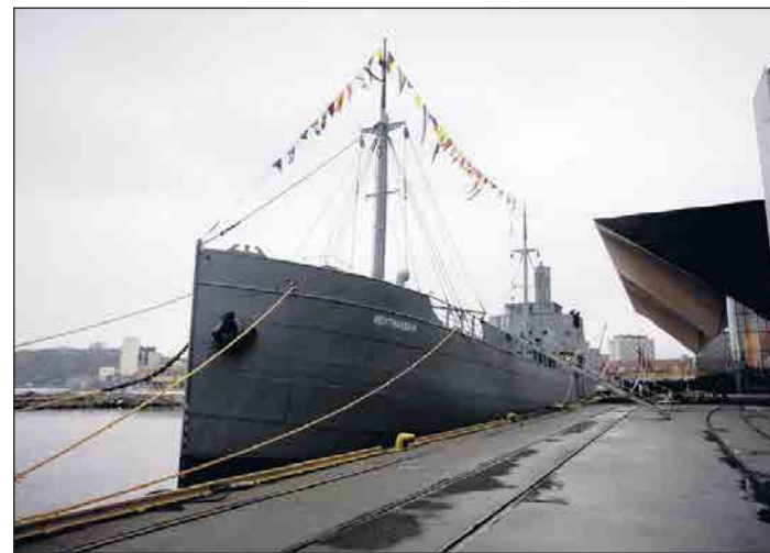
TIL KAI: Manglende driftsstøtte gjør at «Hestmanden» blir liggende til kai i Kristiansand.