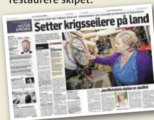
Klassekampen 14. desember

– Hva vil du gjøre dersom det ikke kommer midler til å drifte «Hestmanden»?